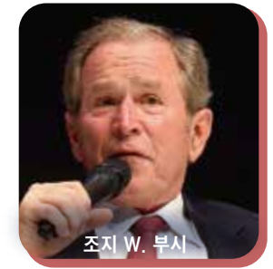
조지 W. 부시